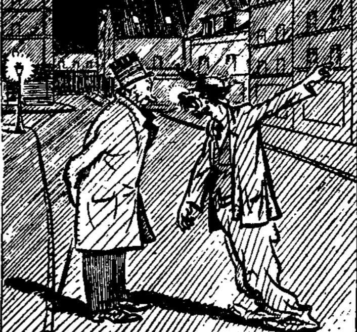
—Pero en qué estado está usted, amigo mío! ¿Por qué no se va a su casa! —¡Venga a casa! Allí quisiera yo verla a usted con la parienta, que me espera con una estaca gruesa como mi brazo. (De "Le Journal Amusant", de París.)