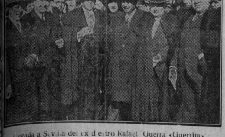
Llegada a Sevilla del ex diestro Rafael Guerra «Guerrita»

El coloso de Córdoba, el famoso Guerrita, que presidía, concedió la oreja de los bichos que respectivamente despacharon, al sevillano, al trianero y al de Castilleja de la Cuesta