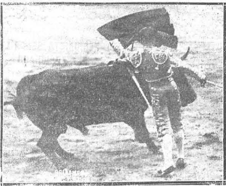
Bejarano pasando de muleta al quinto toro.